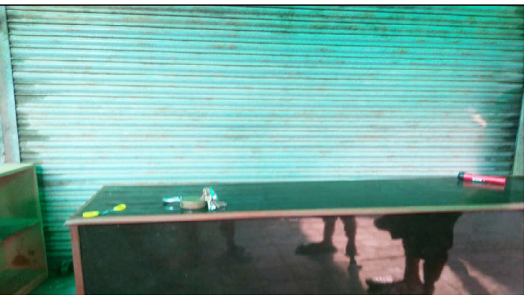
ज्योति जेनरल्समा चोरले तोड्न खोजेको ताल्चा।

यसै सन्दर्भमा सक्ने व्यापारीले आफ्नो पसलमा सिसिटिभि जडान गर्न आवश्यक रहेको एक व्यापारी जनाउँछन्। नगर प्रहरी र जनपद