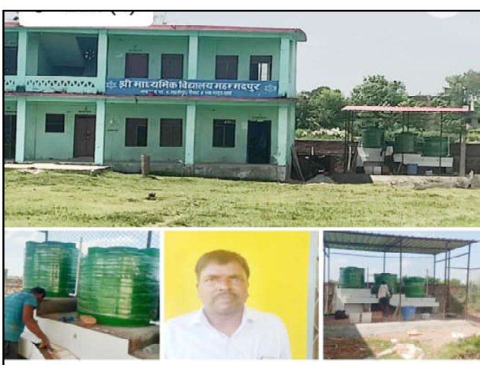
श्री माध्यमिक विद्यालय महम्मदपुर।